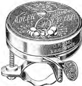
Nr. 1779 55 mm Metal Pris Kr. „Adler Cycler“ Nr. 1780 55 mm Metal Pris Kr. samme Klokke som 1779 med eget Firma, naar mindst 100 Stk. heordres.