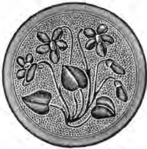
Nr. 1776 55 mm. Pris Kr. „Viol“ malet i Naturfarver.