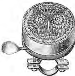
Nr. 1783 55 mm. Metal „Ugle“ oecideret med Glasejne Pris Kr.