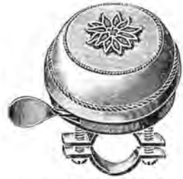
Nr. 1782 50 mm Metal „Edelweiss“ malet i Naturfarver Pris Kr.