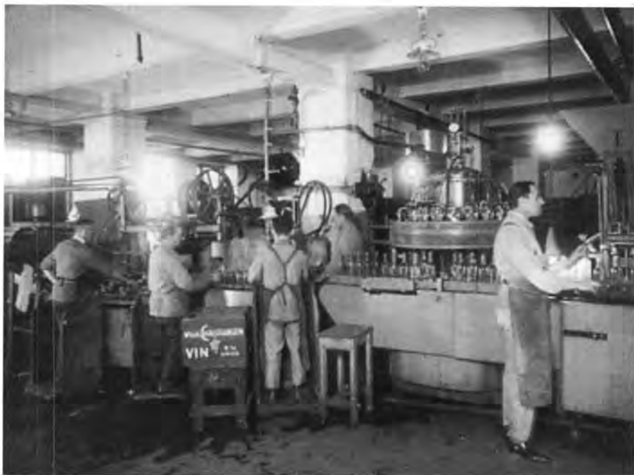
Det kombinerede tappe- og skyllerum hos vinfirmaet Vilh. Christiansen, København, fotograferet i anledning af et jubilæum 1933. Fotosamlingen i dette arkiv rummer optagelser af arbejdet i firmaets kontorer og pakhuse og desuden en lang række medarbejderbilleder. Lignende billedsamlinger indgår i andre handelsarkiver.

1845-46 (1). Adgangsbevis for prøvehandel.