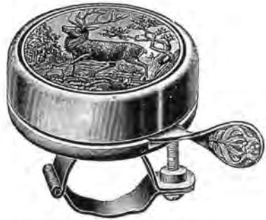
Nr. 1777 55 mm. Staal Pris Kr. „ 1778 „ Metal „ „