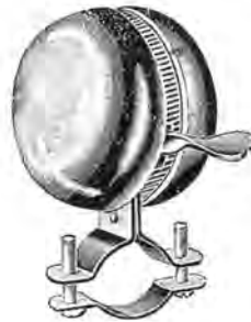
Nr. 1784 55 mm. Staal Dobbelt- Trilleslags-Klokke Pris Kr.