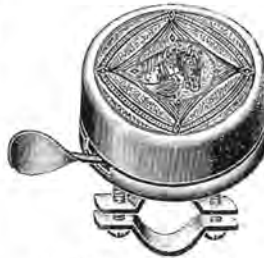
Nr. 1781 55 mm. Staal fint oecideret. Pris Kr.