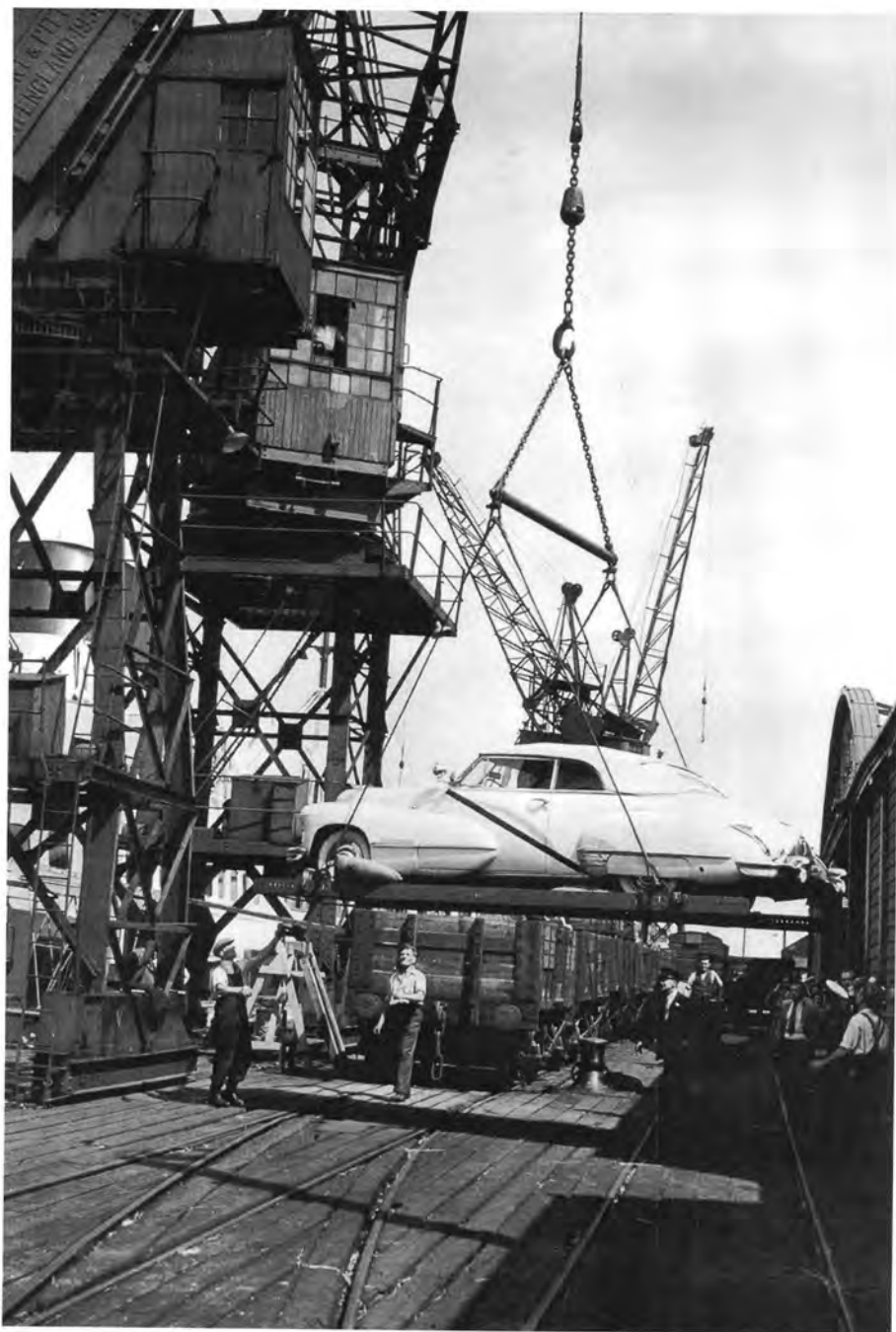
Blandt arkiverne med de største billedsamlinger er rederierne DFDS og Lauritzen. Skibe, skibsinteriører, stabelafløbninger, passagerer og mandskab, losning og lastning er rigt illustreret gennet de sidste mere end hundrede år. DFDS har en specialsamling med kongelige personer og andre berømtheder. Fra denne ses losningen af Carl Brissons cadillac fra Kronprinsesse Ingrid i Harwich.