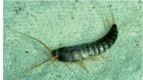
Billede 4: Borebiller, sølvkræ, mus og rotter kan forrette store skader på arkivalier.

Skader som følge af brand og vand er umiddelbart til at tage og føle på. Den langsomme nedbrydning af arkivalierne p.g.a. slid, lys, forkert luftfugtighed, temperatur, luftforurening, bakterier, svampe og skadedyr så som borebiller, sølvkræ, mus og rotter er i realiteten mere farlig og omfattende.