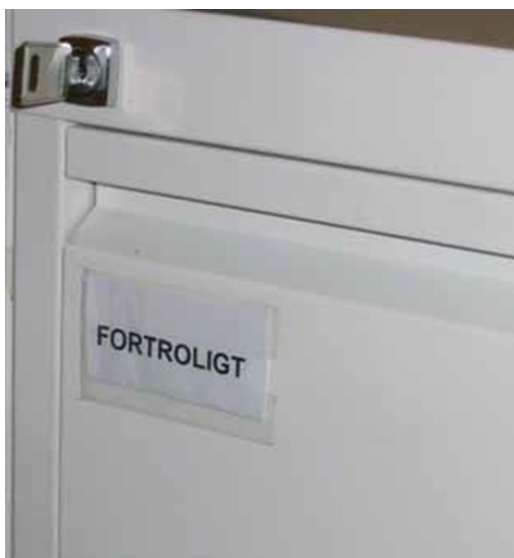
Billede 11: Fortroligt materiale skal også afleveres til Rigsarkivet, men der kan dispenseres for den 30-årige afleveringsfrist.

Myndighederne vil som hovedregel blive bedt om at aflevere hele arkivsystemer. Det betyder, at myndigheden foruden sagerne fra en journalperiode skal aflevere den tilhørende journalplan og de tilhørende journaler og registre. Dog afleveres en arkiveringsversion af elektroniske journalsystemer umiddelbart efter arkivperiodens lukning, og denne vil typisk være afleveret længe inden de tilhørende papirarkivalier. Se kapitel 4, afsnittet om aflevering af elektroniske arkivsystemer.