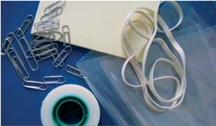
Billede 9: Mange kontormaterialer er praktiske i hverdagen, men kan på sigt ødelægge arkivalierne, og skal derfor fjernes, når sagen lukkes.

Bestemmelser om kassation effektueres, når myndigheden skønner, at arkivalierne ikke længere har retslig eller administrativ betydning. For arkivalier der skal bevares, gennemføres derefter: