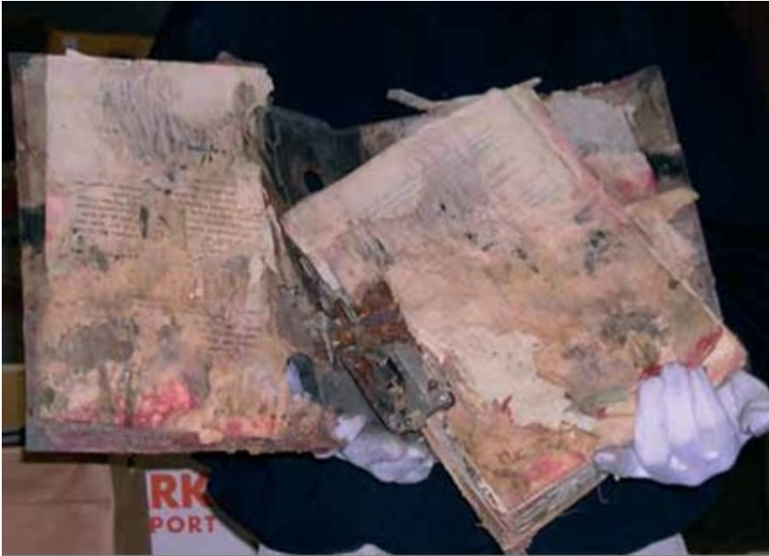
Billede 5: Arkivalie angrebet af svamp pga. fugtig og forkert opbevaring