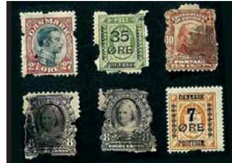
Billede 6: Frimærkerne på billedet er skadet af sølvkræ.