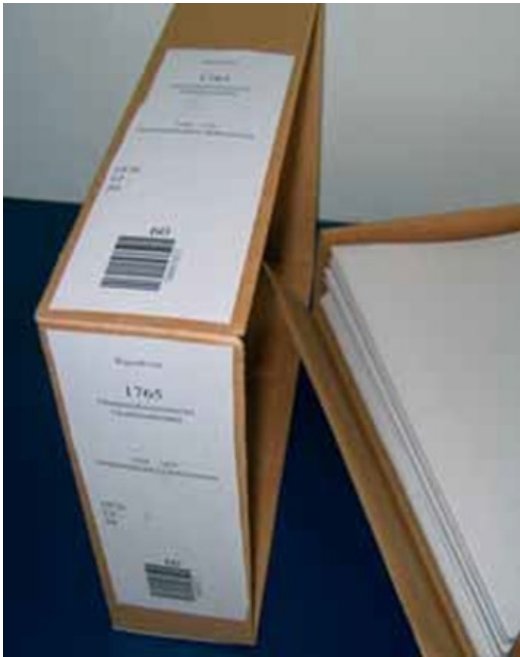
Billede 10: Når arkivalierne afleveres til Rigsarkivet, skal de være pakket korrekt.