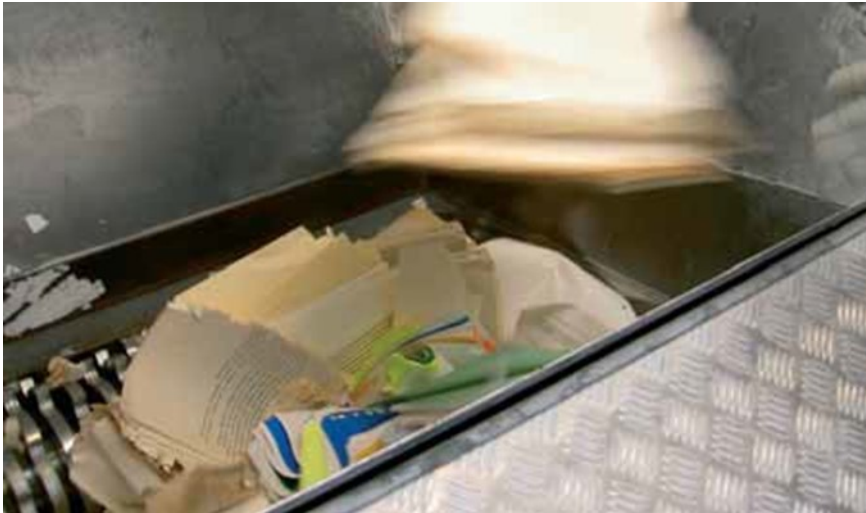
Billede 8: Kasserede arkivalier skal destrueres på betryggende vis fx ved makulering som vist her