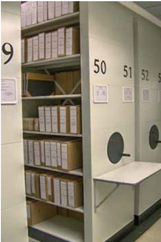
Billede 3: Compactus-reoler skaber bedre plads i arkivet

Kort, tegninger, bånd, film mv. kan enten indgå i en sag eller udgøre en særlig arkivserie. Hvilken løsning, myndigheden vælger, afhænger bl.a. af format, mængde, og hvor hyppigt materialet bliver brugt.