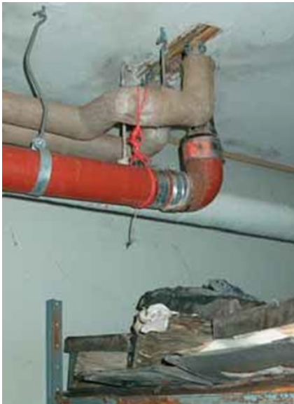
Billede 2: Vand fra utætte rør kan gøre stor skade på arkivalier og hører ikke hjemme i et arkivlokale